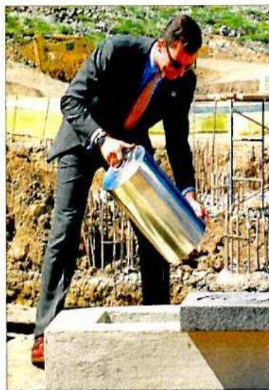
Con la familia. En junio de 2000, el príncipe Felipe ponía la primera piedra del Gran Telescopio de Canarias (Grantecan), una institución con la que siempre ha mantenido relación por su interés por la astronomía (s). A finales de 2005, los príncipes de Asturias pasaron unos días en La Mareta (Lanzarote) con la infanta Leonor, que apenas tenía dos meses. En septiembre 2012, Felipe y Letizia visitaron La Gomera para interesarse por las consecuencias del incendio forestal que se había producido en la Isla y, tras reunirse con los afectados, pasearon por el Parque Nacional de Garajonay.