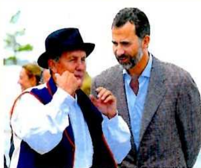
Por todas las Islas. Saludando a los enfermos del Hospital San Martín de Las Palmas de Gran Canaria. Inauguración del mirador de Betancuria (Fuerteventura). Interesado por el silbo gomero.